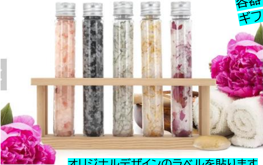
オリジナルデザインのラベルを貼ります