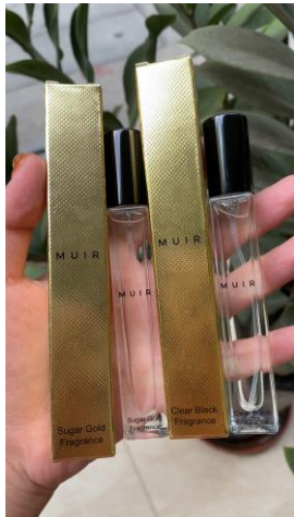
箱付き10mL入りスプレーの制作事例

香りの種類:レディース、メンズ、ユニセックスの 高級感ある香りを取りそろえております。 約50種類の中からお選びいただけます。 お気に入りのfragranceに似た香りも！